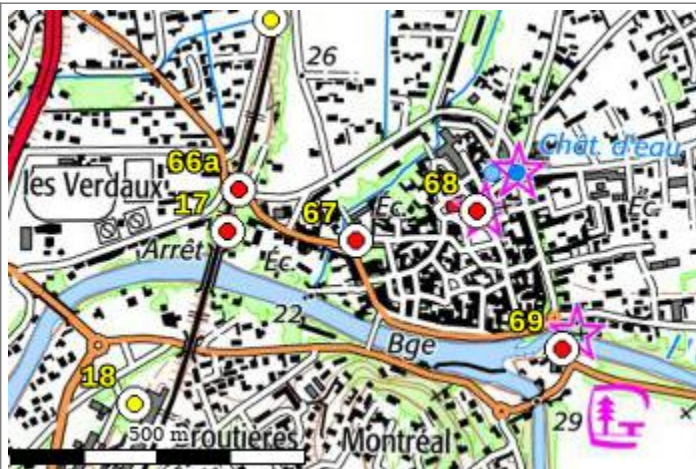
Carte : 3041 AVIGNON

Compte-tenu des risques de déplacement des repères, il est indispensable de rattacher vos opérations de nivellement à plusieurs repères proches, ceci afin de contrôler leur stabilité.