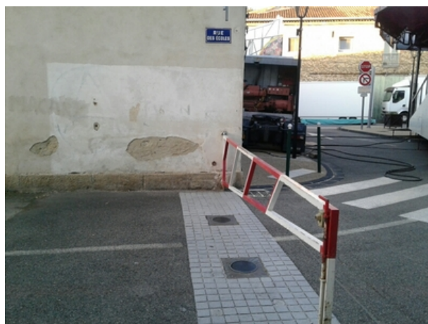
Le repère est au centre de la photo

Liste des repères du triplet : V'.G.L3M3 - 17 , V'.G.M3 - 66a , V'.G.M3 - 67 , V'.G.M3 - 68 , V'.G.M3 - 69