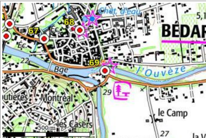
Carte : 3041 AVIGNON

Compte-tenu des risques de déplacement des repères, il est indispensable de rattacher vos opérations de nivellement à plusieurs repères proches, ceci afin de contrôler leur stabilité.