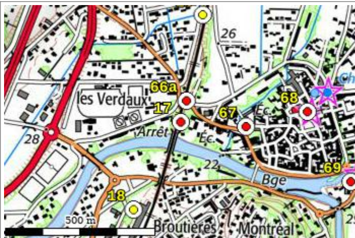
Carte : 3041 AVIGNON

Compte-tenu des risques de déplacement des repères, il est indispensable de rattacher vos opérations de nivellement à plusieurs repères proches, ceci afin de contrôler leur stabilité.