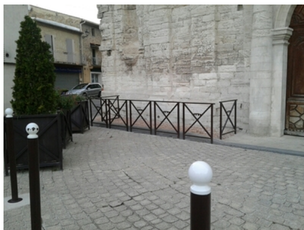
Le repère est au centre de la photo

Liste des repères du triplet : V'.G.L3M3 - 17 , V'.G.M3 - 66a , V'.G.M3 - 67 , V'.G.M3 - 68 , V'.G.M3 - 69