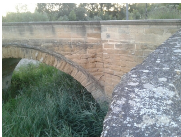
Le repère est au centre de la photo

Liste des repères du triplet : V'.G.L3M3 - 17 , V'.G.M3 - 66a , V'.G.M3 - 67 , V'.G.M3 - 68 , V'.G.M3 - 69