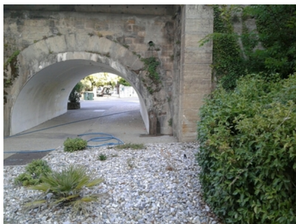
Le repère est au centre de la photo

Liste des repères du triplet : V'.G.L3M3 - 17 , V'.G.M3 - 66a , V'.G.M3 - 67 , V'.G.M3 - 68 , V'.G.M3 - 69