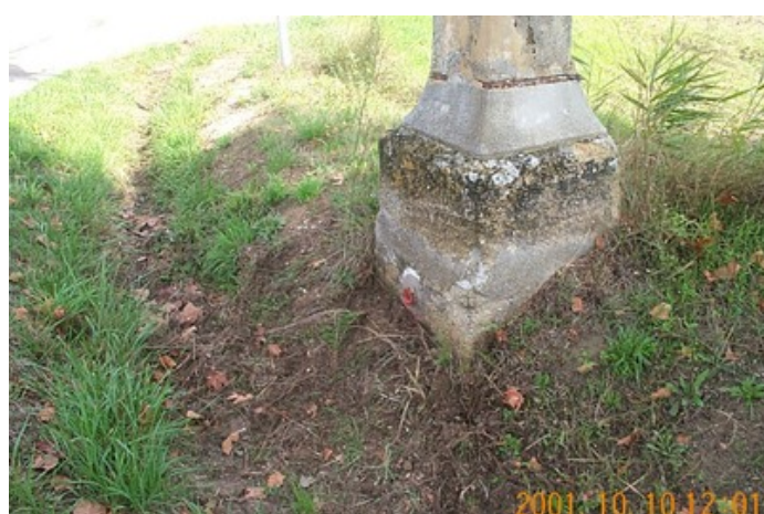
Le repère est au centre de la photo

Remarques : Exploitable directement par GPS