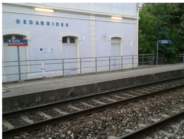
Le repère est au centre de la photo

Liste des repères du triplet : V'.G.L3M3 - 17 , V'.G.M3 - 66a , V'.G.M3 - 67 , V'.G.M3 - 68 , V'.G.M3 - 69