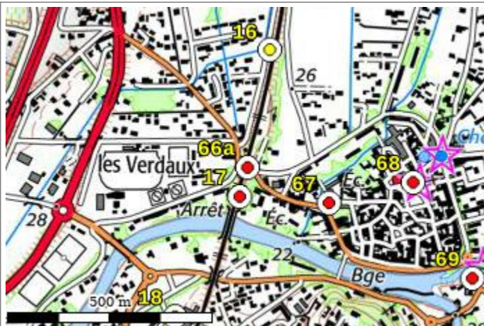
Carte : 3041 AVIGNON

Compte-tenu des risques de déplacement des repères, il est indispensable de rattacher vos opérations de nivellement à plusieurs repères proches, ceci afin de contrôler leur stabilité.